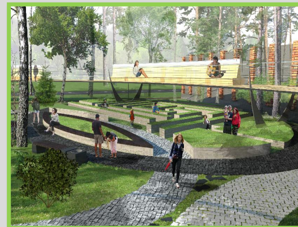
Школа на 550 учащихся в Тучково