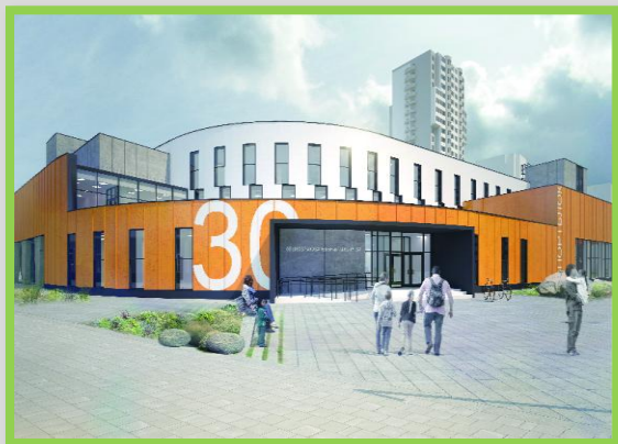
Проект пристройки к зданию общеобразовательной школы на 400 учащихся в Балашихе