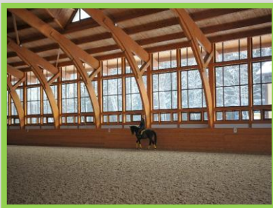
Конноспортивный комплекс «Звездный» в Щелковском районе