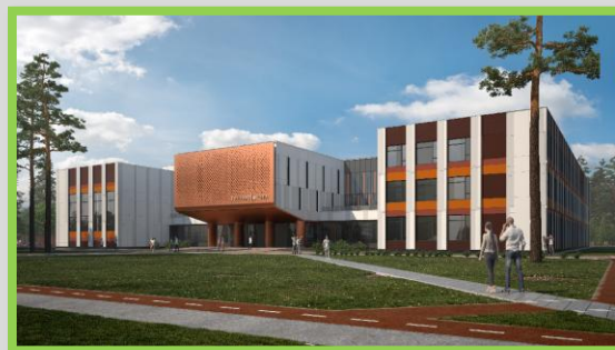
Проект парка им. Маяковского в Пушкино