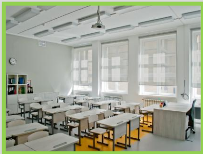
Школа на 768 учащихся в Мытицах