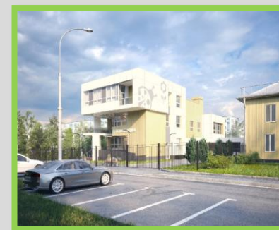
Проект реконструкции детского сада под детскую поликлинику в Куровское