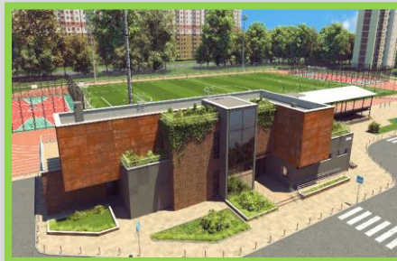
Проект реконструкции стадиона «Машиностроитель» в Красногорске